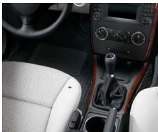
Préparation de l'habitacle