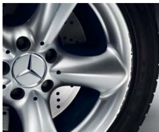
Remise en état des jantes