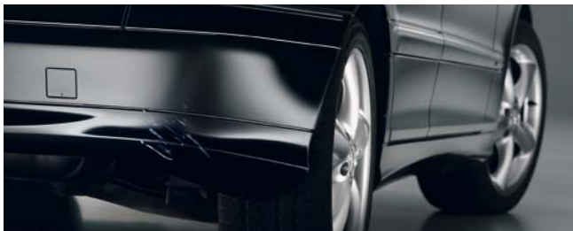
Réparation de dommages de peinture