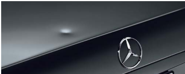
Suppression de bosses